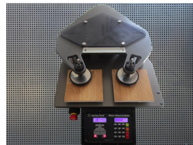
马丁代尔耐磨测试仪