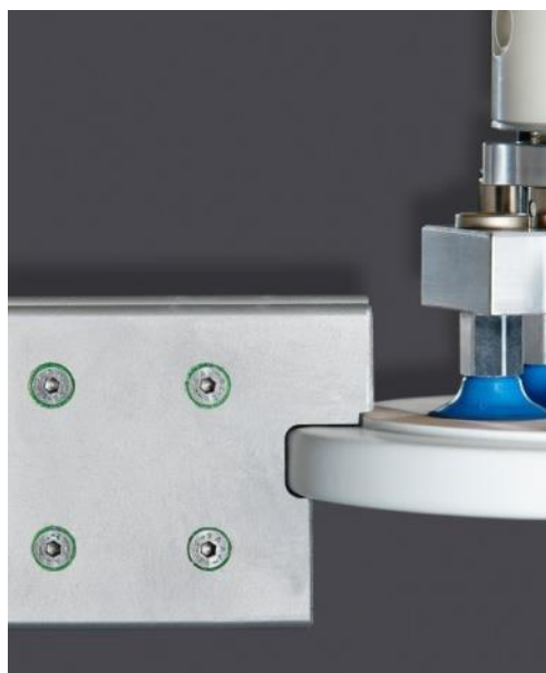
TRANSFERDISC by Schiele Maschinenbau GmbH