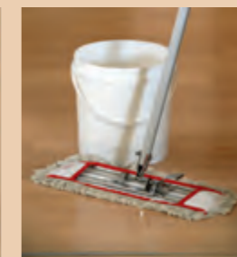
2. 定期式清洁法 - 可使用水性清洁剂或酸性水溶液