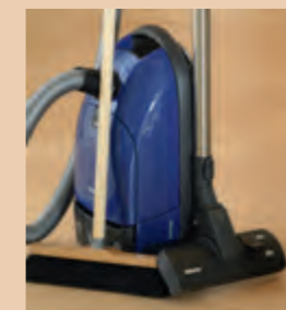
1. 干式清洁法 - 可使用软刷或吸尘器