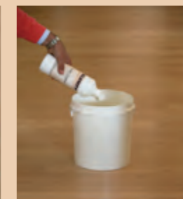
3. 保养 - 使用水性保护剂来保养地板